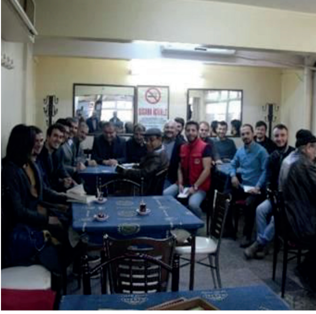
Resim 2. Çankırı Huzur Millet Kıraathanesi (Çankırı Millet Kıraathanesi, 2018).

Gençlik ve Spor Bakanlığı tarafından uygulamaya konulan 'Kıraathaneler Aslına Dönüyor' projesi kapsamında Çankırı'da bir kıraathanede toplanan gençler kitap okumuşlardır. Cumhuriyet Mahallesi'nde bulunan 'Huzur Kıraathanesi'nde toplanan Çankırı Gençlik Hizmetleri ve Spor İl Müdürlüğü'ne bağlı Şehit Uhud Kadir Işık Gençlik Merkezi üyeleri ve Çankırı Karatekin Üniversitesi Bilgi ve Belge Yönetimi öğrencileri, sohbet edip kitap okumuşlardır. Kıraathanede toplanan gençler, kıraathanelerin geçmişte dini sohbetlerin, tanışmaların ve muhabbet yapılması için oluşturulan bir yer olduğunu belirttiler. Genç katılımcılar olumlu tepkiler aldıklarını dile getirdiler.