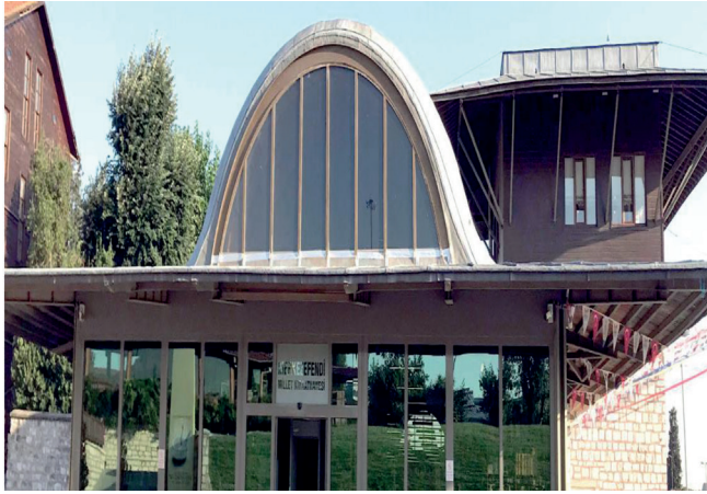
Resim 4. MerkezEfendi Millet Kırathanesi (Cevizlibağ MerkezEfendi Millet Kırathanesi, 2018).

açısından tercih ettiğini belirtmektedir. Millet Kırathanesi projesinin, öğrenciler için nimet olduğuna dikkat çekmektedir. Nedenini ise şu sözlerle anlatmaktadır: “Bu kırathaneler Türkiye’de neredeyse tamamı yoksul öğrenci kesimi için önemli durumdadır. Gününü bir simitle geçirmeye çalışan, interneti olmayan, çay parasını, çorba parasını zor bulan öğrenci için, bu kurumlar büyük bir nimet durumundadır. Ben bunu sosyal devlet anlayışı içerisinde değerlendiriyorum. Öngörüm şu ki; zamanla başka aktivitelerle de burası kültür merkezi durumuna gelecektir. Belirttiğiniz gibi şu anda çok kalabalık durumda değil, sadece öğrenciler sürekli kullanılmaktalar. Ama bir süre sonra tüm vatandaşlar buradaki potansiyeli fark edecektir. Kahve köşelerinde saatlerce kâğıt oynamaktan daha iyi bir alternatifin olduğunu anlayacaklardır. Burada en büyük görev belediyelerde bulunmaktadır. Belediyeler, bu merkezlerin yaygınlaştırılmasını ve kapasite olarak daha da büyümesini sağlamalıdır. Millet kırathaneleri zaman içerisinde aynı zamanda öğrenciler için sosyalleşebilecekleri bir alan durumuna da gelecektir. Kırathanelerin kesintisiz 7/24 açık olması en büyük temennimizdir” (Cevizlibağ Millet Kırathanesi, 2018).