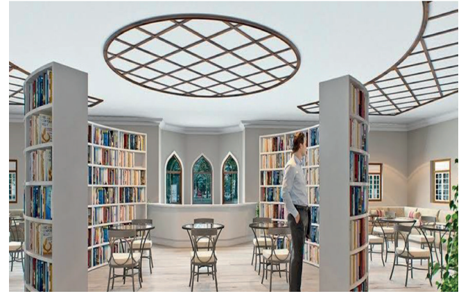
Resim 5. Millet Kırathaneleri Modeli

Bilgi bir güçtür ve bilgi, insanları yücelten bir değerdir.