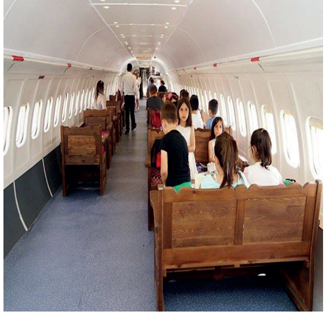
Resim 3. Kastamonu Millet Kıraathanesi (Kastamonu Millet Kıraathanesi, 2018).

Cumhurbaşkanı Recep Tayyip Erdoğan'ın 24 Haziran seçimi öncesi seçim vaatleri arasında yer alan 'Millet Kıraathanesi' projesinin en ilginç örneği Kastamonu'da hayata geçirildi. Hurdadan alınan MD-82 tipi yolcu uçağı, Kastamonu'da Millet Kıraathanesi olarak hizmet vermeye başladı. Uçak, montaj çalışmaları tamamlandıktan sonra diğerlerinden farklı olarak Kastamonu Belediyesi tarafından 'Millet Kıraathanesi' olarak hizmet vermek üzere ziyarete açıldı. Uçak Kıraathanesini çok beğendiğini söyleyen bir vatandaş "bu tür faaliyetlerin yaygınlaştırılması gerektiğini düşünüyorum. Vatandaşlar için hem kültürel anlamda hem sosyal anlamda güzel olmuştur. Bundan sonra da bu tür faaliyetlerin yaygınlaşacağı kanaatindeyim" dedi. Uçağı ziyaret eden vatandaşlar hem yerel hem de ulusal gazeteleri çay ve kek ikramları ile okuma fırsatı buldu. Ziyarete gelen öğrenciler de öğretmenleri nezaretinde hem oyun oynama hem de kitap ve gazete okuma fırsatı buldular" (Kastamonu Millet Kıraathanesi, 2018).