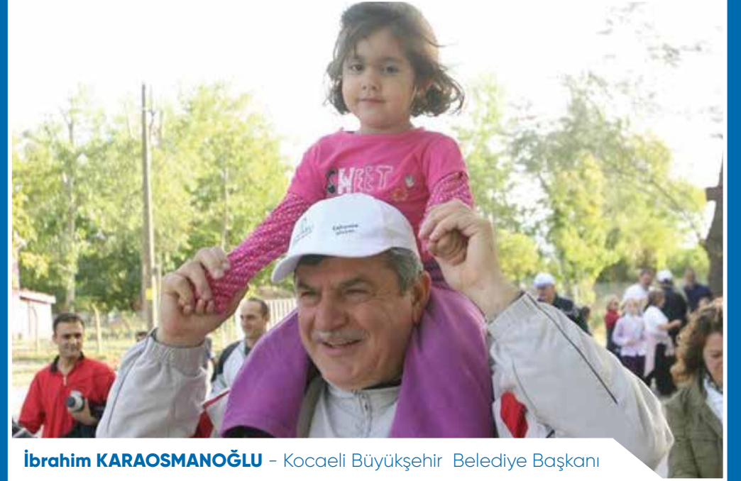
İbrahim KARAOSMANOĞLU - Kocaeli Büyükşehir Belediye Başkanı