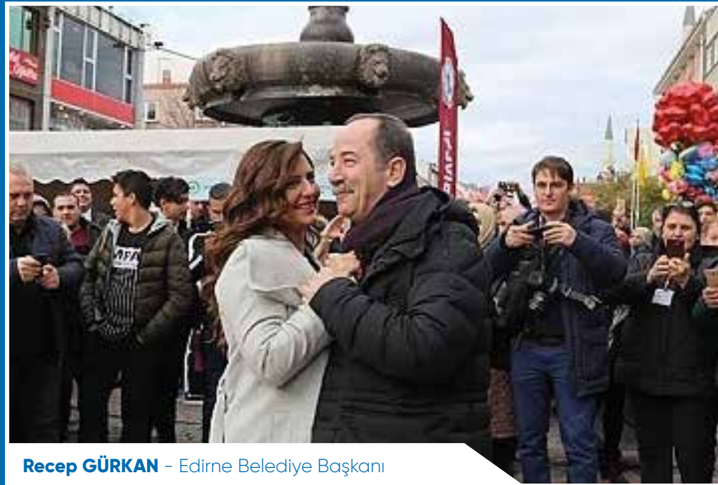
Recep GÜRKAN - Edirne Belediye Başkanı