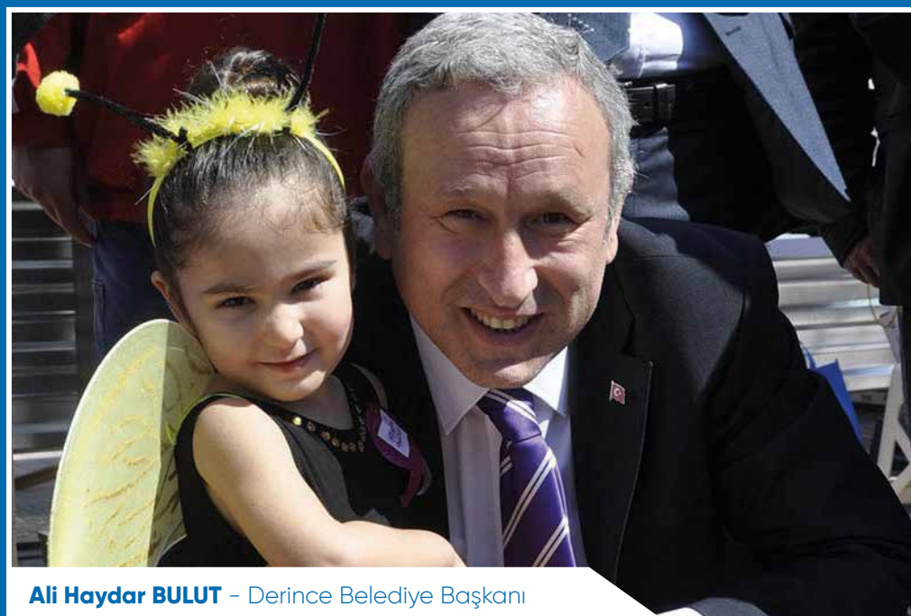
Ali Haydar BULUT - Derince Belediye Başkanı