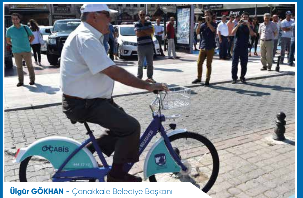
Ülgür GÖKHAN - Çanakkale Belediye Başkanı