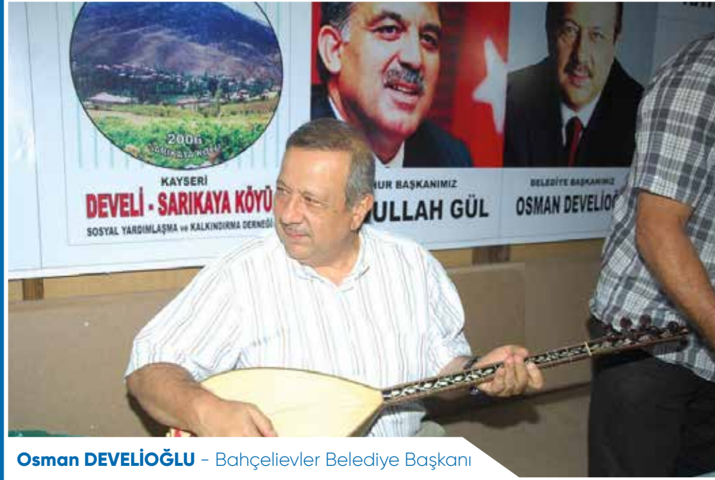
Osman DEVELİOĞLU - Bahçelievler Belediye Başkanı