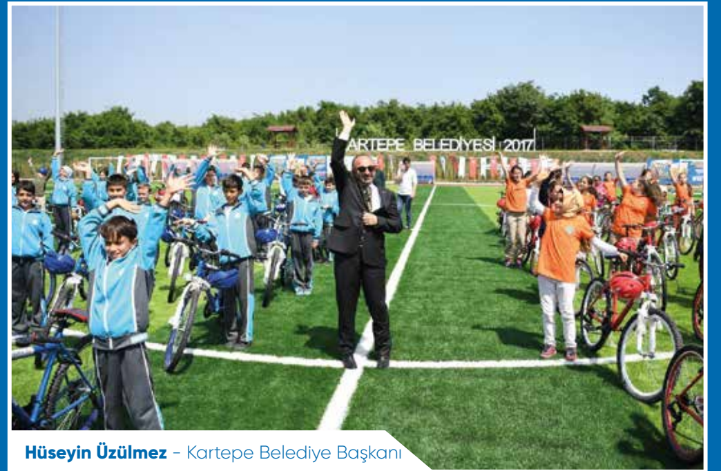
Hüseyin ÜZÜLMÜŞ - Kartepe Belediye Başkanı