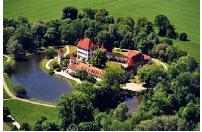
Münih'e bağlı Obermenzing'de bulunan Blumenberg Şatosu'nun tarihi binalarındaki Uluslararası Çocuk ve Gençlik Kütüphanesi (Internationale Jugendbibliothek – IJB)

Günümüzde kütüphaneler sadece ders çalışılan ve ödevlerin yapıldığı hikaye, roman ve diğer eserlerin okunduğu yerler olarak değerlendirilmemeli. Bu kütüphaneler, bilgi toplumunun bireylerinin yeni teknolojileri tanımaları ve kullanmalarına olanak sağlayacak mekânlar haline dönüştürülmelidir. Çocukların, gençlerin sosyalleşebilecekleri, akranları ile buluşup vakit geçirebilecekleri, ortak aktiviteleri beraber yürütebilecekleri alternatif yaşam alanı olarak görmelerini sağlayacak fiziki şartlarda mekânlar olarak tasarlanan kütüphaneler her zaman cazibe merkezi olacaktır.