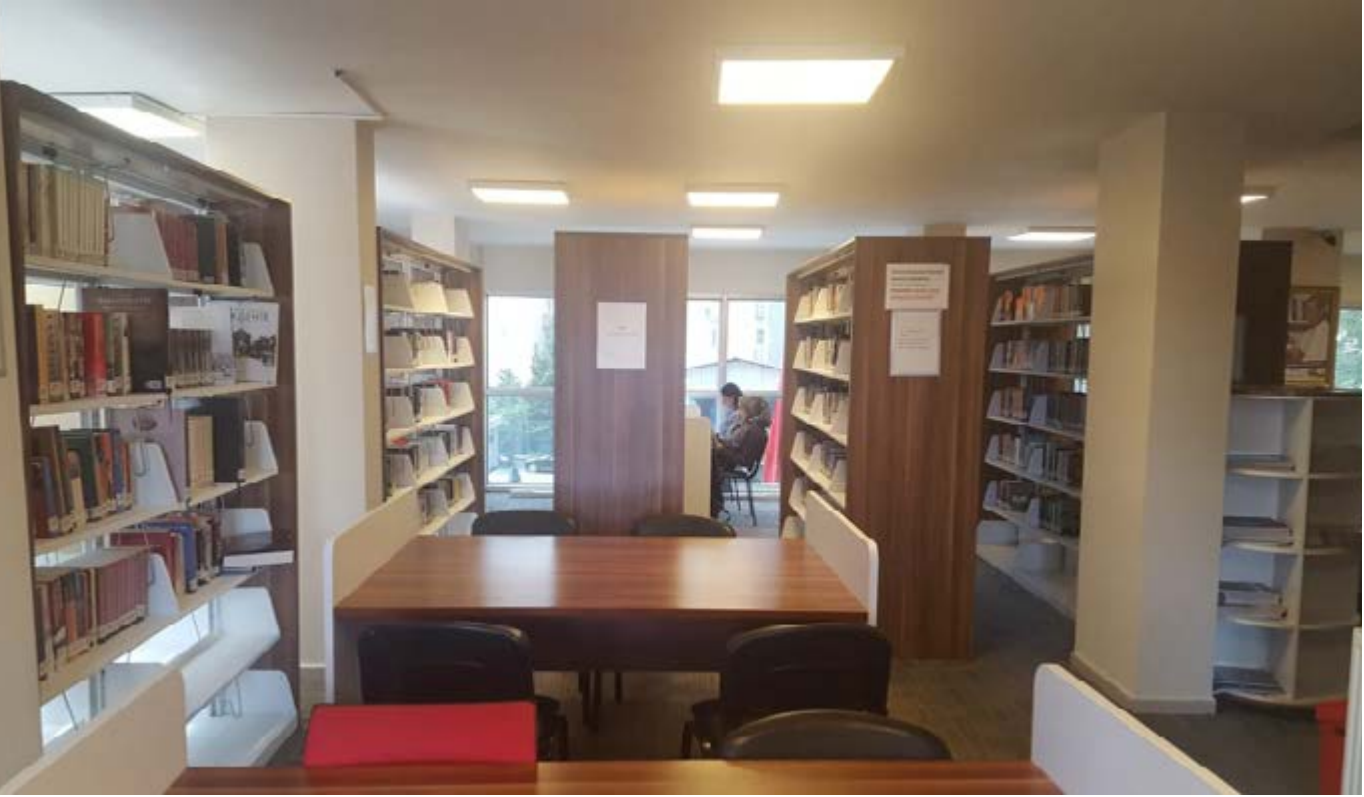
Yetişkin bölümünden bir kare

Haftanın her günü açık olan kütüphane Pazar günleri 10.00-18.00, diğer günler 09.00-18.00 saatleri arasında kullanıcılara hizmet vermektedir.