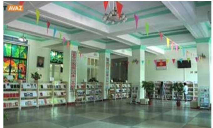
Kırgızistan'ın başkenti Bışkek'te de Kasmalı Bayalınov Çocuk ve Gençlik Kütüphanesi: 1 milyon kitap mevcut. Başkent Bışkek 22 kütüphaneye ev sahipliği yapıyor.

Kütüphanenin misyonu: Tüm dünyadaki çocuk edebiyatını bir kültür mirası ve geleceğe yön veren sanatsal bir araç olarak toplamak, keşfetmek ve paylaşmak. Yetmiş yılı aşkın bir süreden beri büyümeye devam eden ve şu anda 130 dilde 600.000 çocuk kitabını kapsayan koleksiyonun köklü bir geçmişe sahip çekirdeğini, tüm dünyadaki yayınevlerinin düzenli olarak bağışladığı yeni eserler oluşturuyor. Dünyanın pek çok bölgesinde üretim, paylaşım ve veri toplama konusunda sağlam bir altyapının olmaması, IJB'nin arşivinin bu ülkelerin kültürel kimliğinin de arşivi olduğu anlamına geliyor. 30.000 civarında da yabancı kitap var. Edebiyattaki çeşitliliğin insanın deneyim ve duygularına nasıl bir zenginlik kattığını buradaki seminer, atölye ve sanat projelerinde takip etmek mümkün. Yenilikçi yazarlar, sanatçılar, pedagog ve uzmanlar eşliğinde öğrenen çocuk ve gençlere odaklanan diğer bir faaliyet de, Alman yazarlara ithaf edilen ve Michael Ende Müzesi, James Krüss Kulesi ve Erich Kästner Odası'nda müze pedagojisi çerçevesinde gerçekleştirilen daimi sergiler. IJB'nin kreşler ve okullarla da ortak çalışmalar yürütmesi, kütüphanenin kapılarını ziyaretçilere sık sık açmasını ve başarısına başarı katmasını sağlıyor.