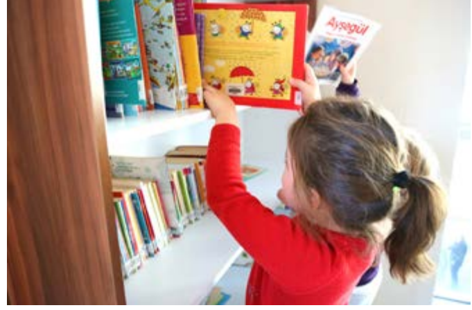
Çocuk bölümünden kareler