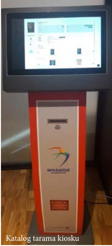
Katalog tarama kiosku

Bu bölümdeki Büyüteç Programlı cihaz sayesinde görme yetisini kaybeden, az gören ileri yaştaki vatandaşlar kolaylıkla kitap okuyabilmekte, el veya vücudunu kullanamayan kişilerin bilgisayarı kimseye ihtiyaç duymadan özel cihazlar ve çipler sayesinde kullanabilme imkanı sunulmuştur.