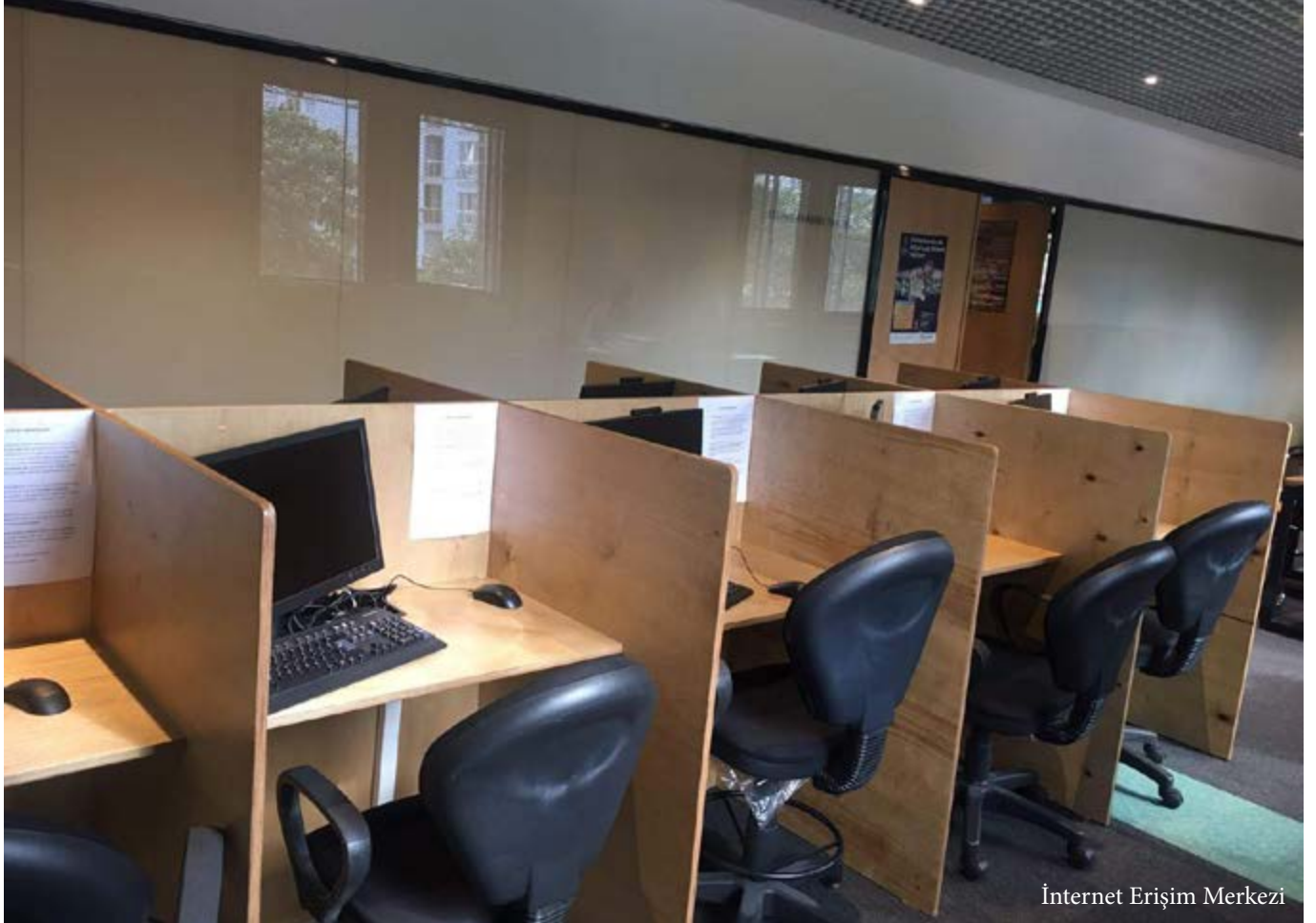
İnternet Erişim Merkezi

Cumhuriyet Mahallesi'nde bulunan Yaşam Vadisi Sanatla Yaşam Kütüphanesi, 750 kitap kapasitesiyle Temmuz ve Ağustos aylarında, 16.00-20.00 saatleri arasında hizmet veriyor. Vatandaşlarımıza Yaşam Vadisi'nin yemyeşil doğasında kitap okuma keyfini yaşatan kütüphanemizden geçen yıl, 400 vatandaşımız faydalanmış olup 450 adet kitap ödünç verilmiştir. Çocuklara yönelik düzenlenen Masal Atölyeleri, Okuma Etkinlikleri katılımcılara eğlenceli vakit geçirmeyi, kitaba farkındalık yaratmayı hedeflemektedir. Yemyeşil çimenlerin üzerinde, masmavi gökyüzünün altında, kuş cıvıltıları içinde çayını ve kahvesini yudumlayarak kitap okumak isteyen tüm kitapseverleri Yaşam Vadisi Sanat ve Edebiyat Kütüphanesi'ne bekliyoruz.