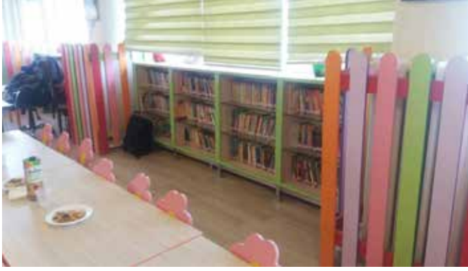
BM Kahramanmaraş Mülteciler Kampı Kütüphanesi

Türkiye, Ürdün ve Lübnan olmak üzere komşu ülkelere sığınmak zorunda kalmıştır.