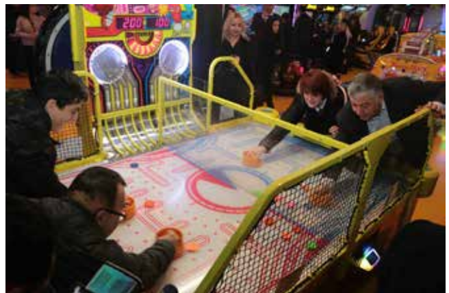
Şükrü Genç Sarıyer Belediye Başkanı