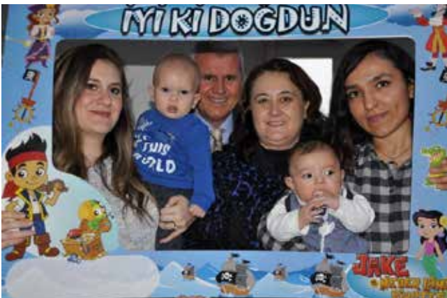
Muzaffer Karataş Karabiga Belediye Başkanı