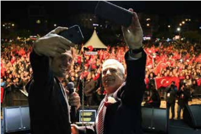
Mustafa Bozbey Nilüfer Belediye Başkanı