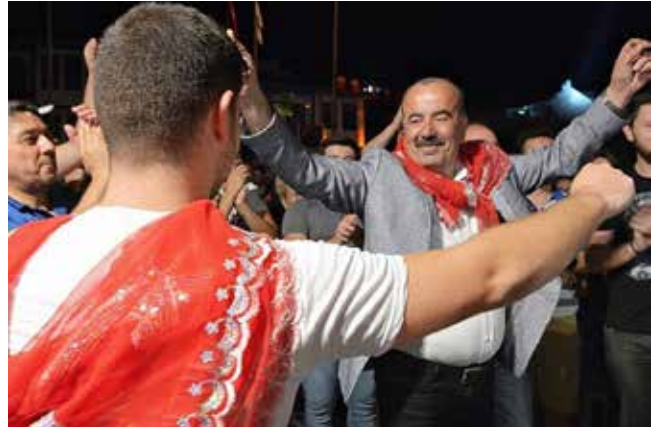
Hayri Tükyılmaz Mudanya Belediye Başkanı