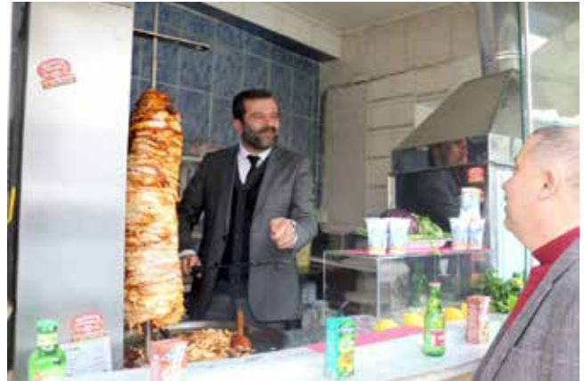
Mustafa Işık Gürsu Belediye Başkanı