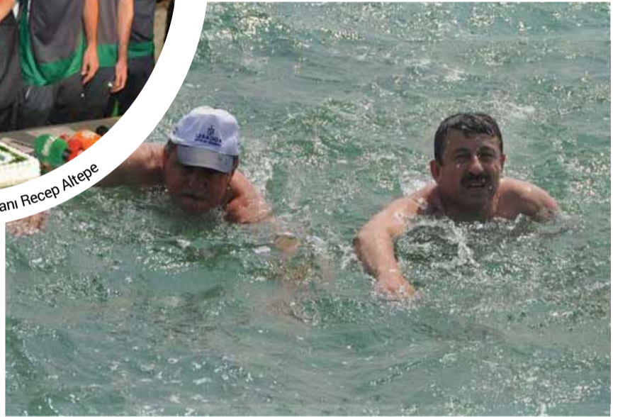
Darıca Belediye Başkanı Şükrü Karabacak