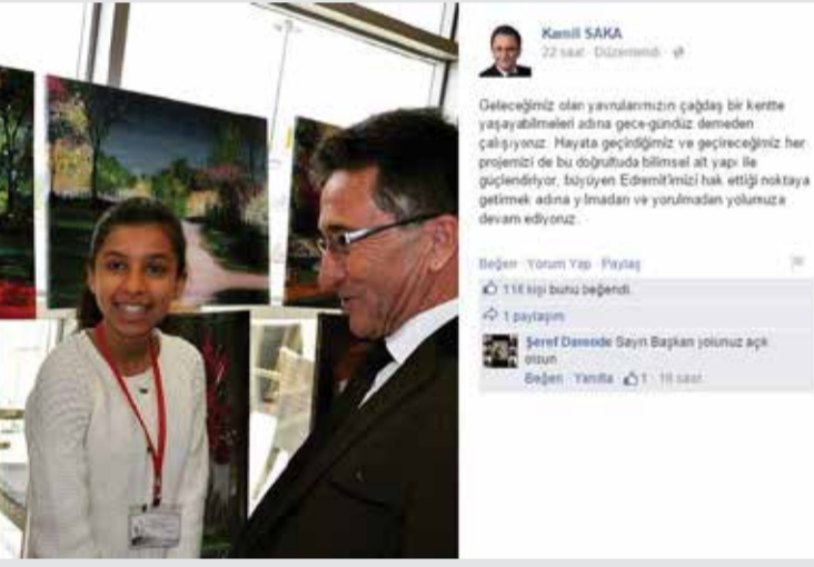
Edremit Belediye Başkanı Kemal Saka