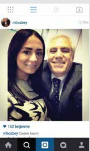
Nilüfer Belediye Başkanı Mustafa Bozbey