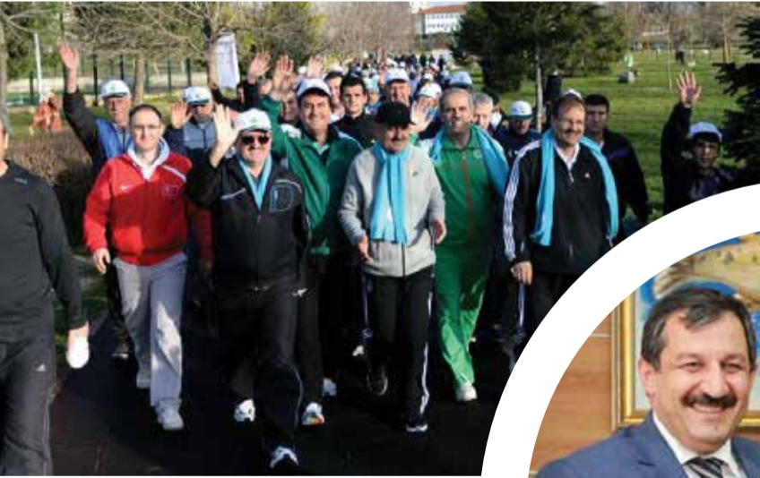
Osmangazi Belediye Başkanı Mustafa Dündar