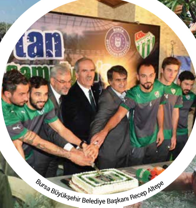
Bursa Büyükşehir Belediye Başkanı Recep Altepe