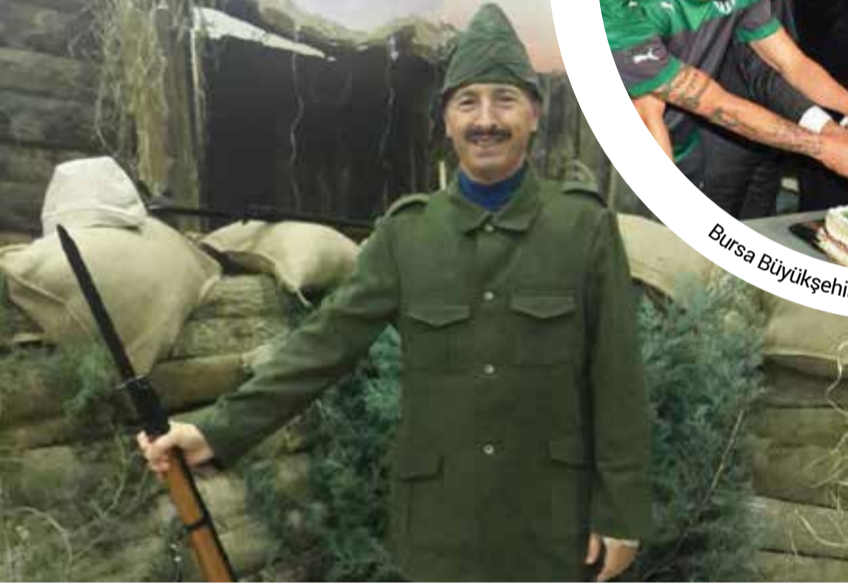
Sultangazi Belediye Başkanı Cahit Altunay