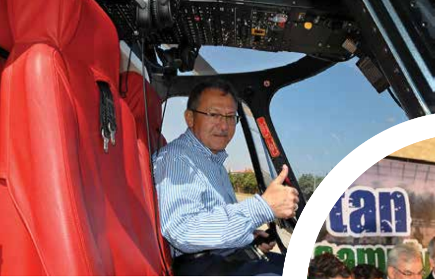
Balıkesir Büyükşehir Belediye Başkanı Ahmet Edip Uğur

Yoğun çalışma tempolarına rağmen halkın içinden çıkmayan ve vatandaşla sıcak iletişim kuran belediye başkanlarının renkli yüzlerini sizlerle paylaşıyoruz.