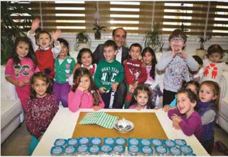
Yıldırım Belediye Başkanı İsmail Hakkı Edebali