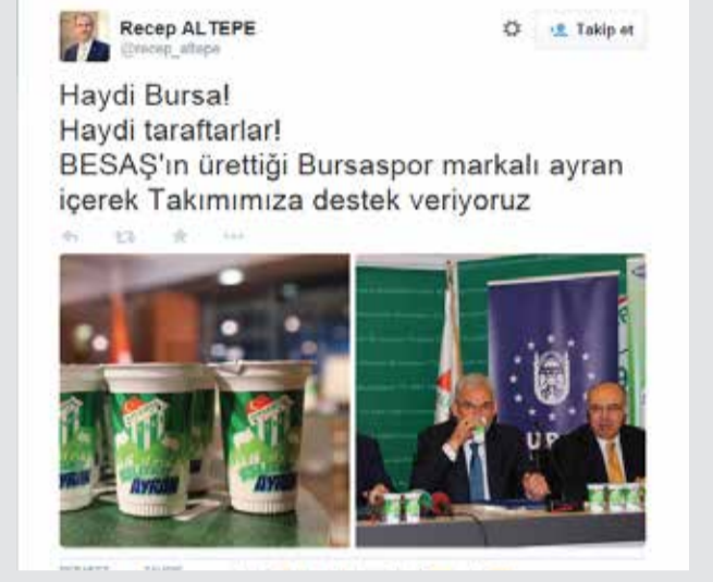
Bursa Büyükşehir Belediye Başkanı Recep Altepe