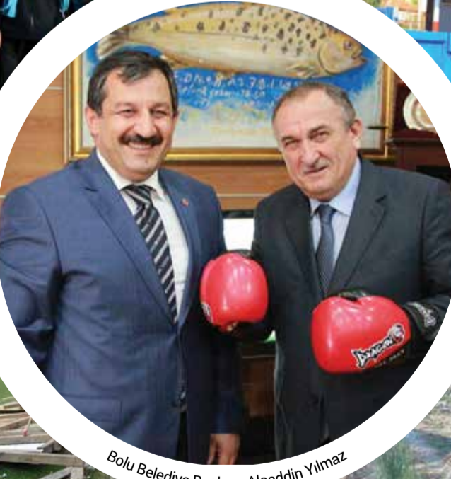
Bolu Belediye Başkanı Alaaddin Yılmaz