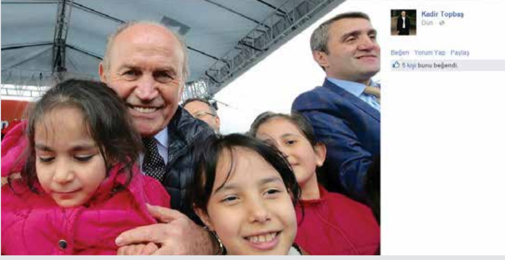
İstanbul Büyükşehir Belediye Başkanı Kadir Topbaş