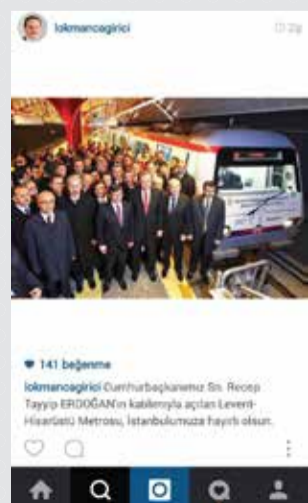
Bağcılar Belediye Başkanı Lokman Çağırıcı