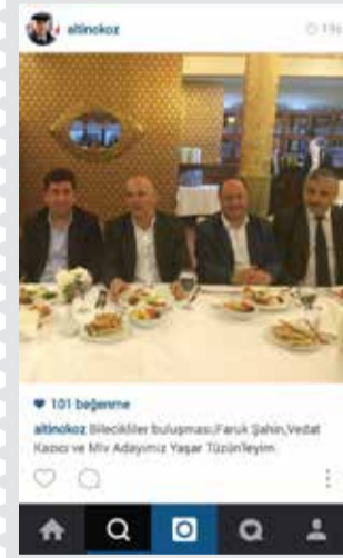
Kartal Belediye Başkanı Altınok Öz