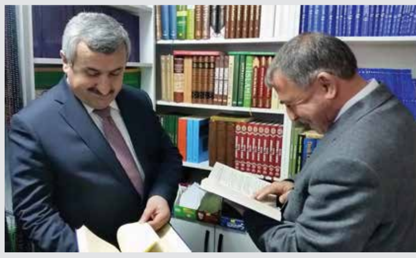
Körfez Belediye Başkanı İsmail Baran