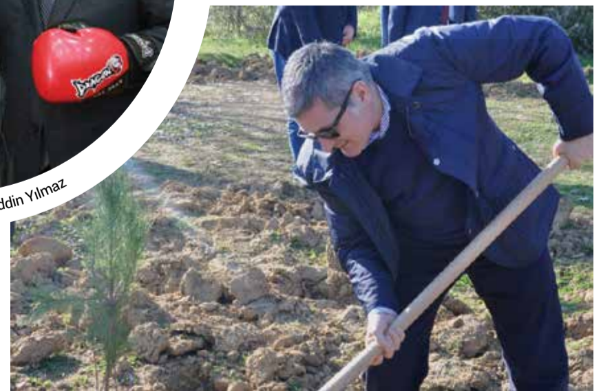
Pendik Belediye Başkanı Kenan Şahin