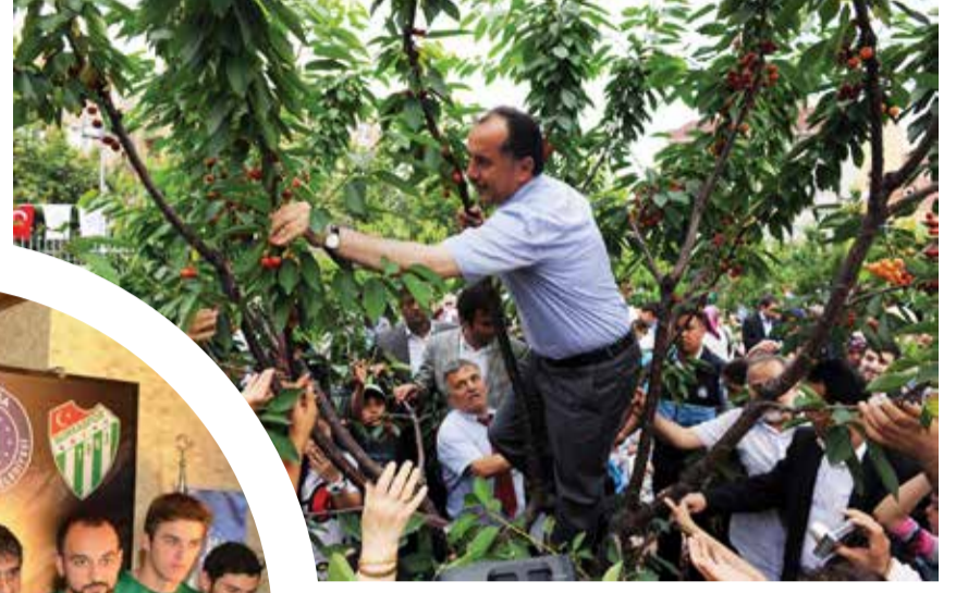
Bağcılar Belediye Başkanı Lokman Çağırıcı