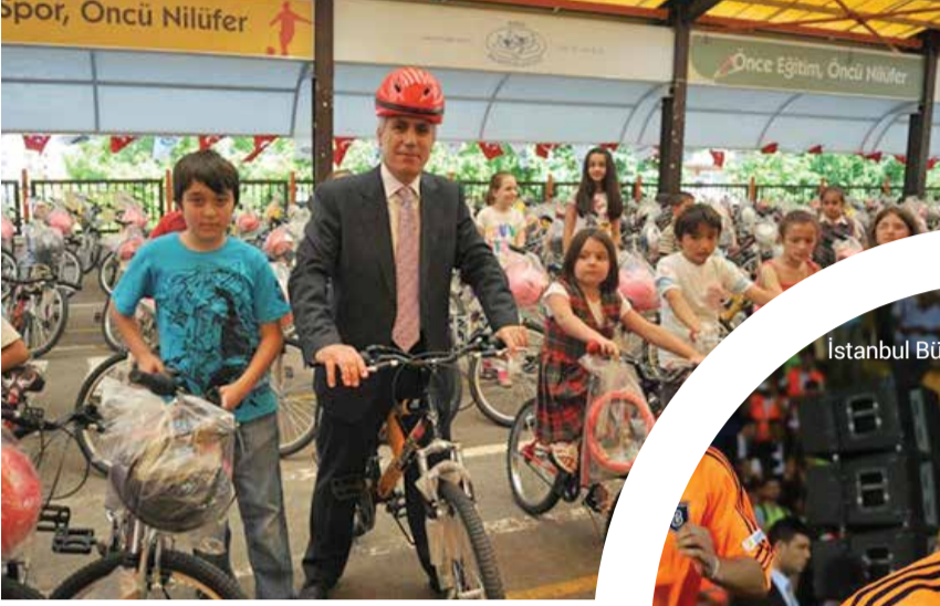
Nilüfer Belediye Başkanı Mustafa Bozbey

Yoğun çalışma tempolarına rağmen halkın içinden çıkmayan ve vatandaşla sıcak iletişim kuran Belediye Başkanlarımızın hayata dair fotoğraflarını yayınlıyor, devamını belediye- rimizden bekliyoruz.