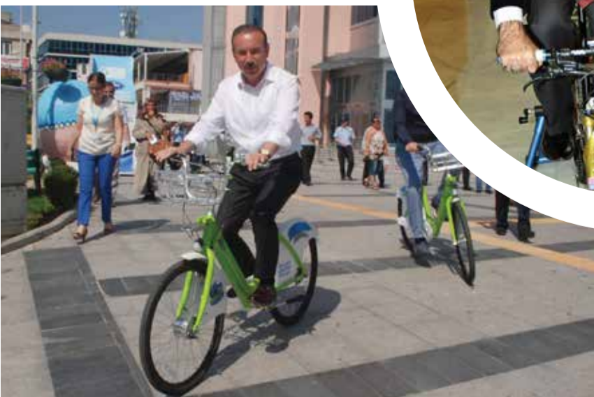
İzmit Belediye Başkanı Nevzat Doğan