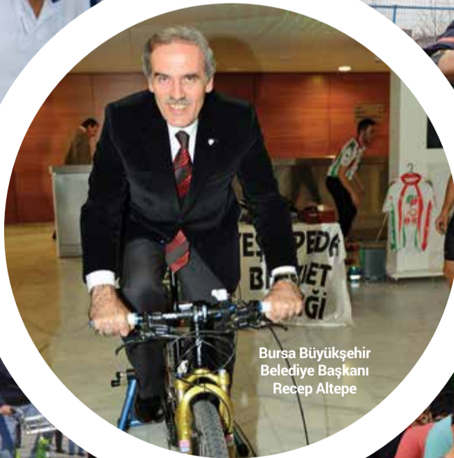
Bursa Büyükşehir Belediye Başkanı Recep Altepe