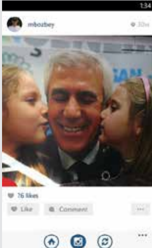
M. Bozbeğ 134 16 likes Like · Comment