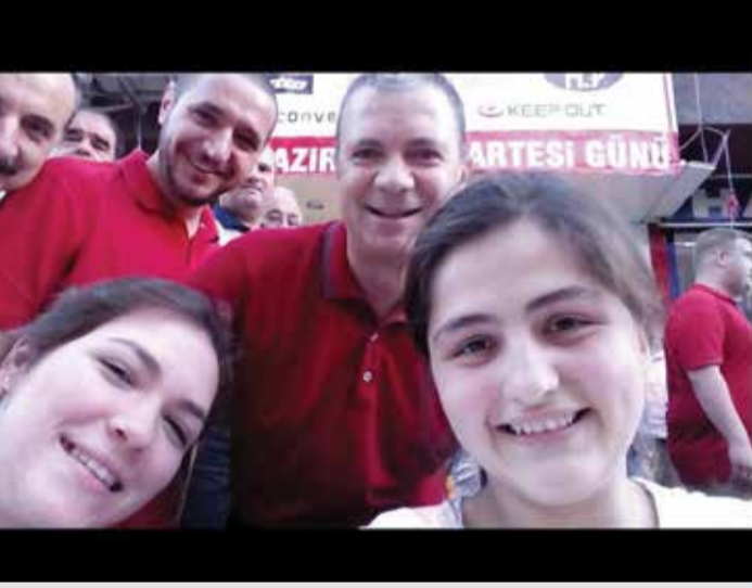
Enis İşbilgen Takip Et · 21 Temmuz Beğen · Paylaş 20 kişi bunu beğendi.