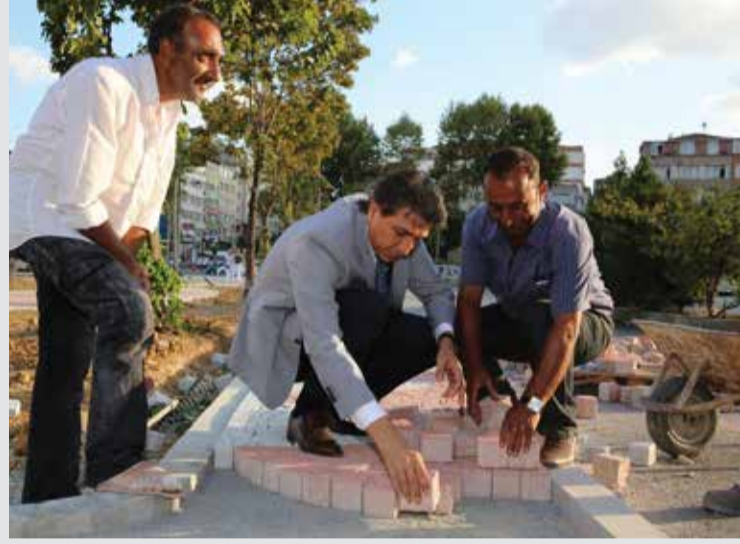
Mustafa Demir 14 Ağustos PARK ÇALIŞMALARIMIZDAN... Beğen · Yorum Yap · Paylaş 219 kişi bunu beğendi. 4 paylaşım 2 diğer yorumları gör Furkan Çantürk Yeni yere koyduğum taşların... 14 Ağustos, 11:28 · Beğen Selma Zağraoğlu Özürtünde katmanlı bir meşale... 14 Ağustos, 11:30 · Beğen Hüseyin Bağkaya Kaldırımın olgun park duşu... 14 Ağustos, 12:28 · Beğen Mahmut İlik Başkaların ailesi için bağışlardan... 14 Ağustos, 13:29 · Beğen · 3 Engin Altın meşale olgun çağıyor aklı adanmış 50... 14 Ağustos, 17:50 · Beğen Ahmet Celebi aklı benim ya... 14 Ağustos, 22:07 · Beğen Yorum yaz