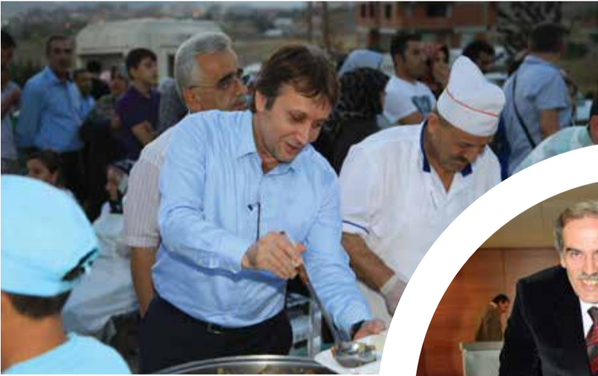
Çayırova Belediye Başkanı Şevki Demirci