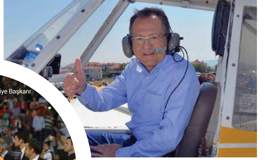
Balıkesir Büyükşehir Belediye Başkanı Ahmet Edip Uğur