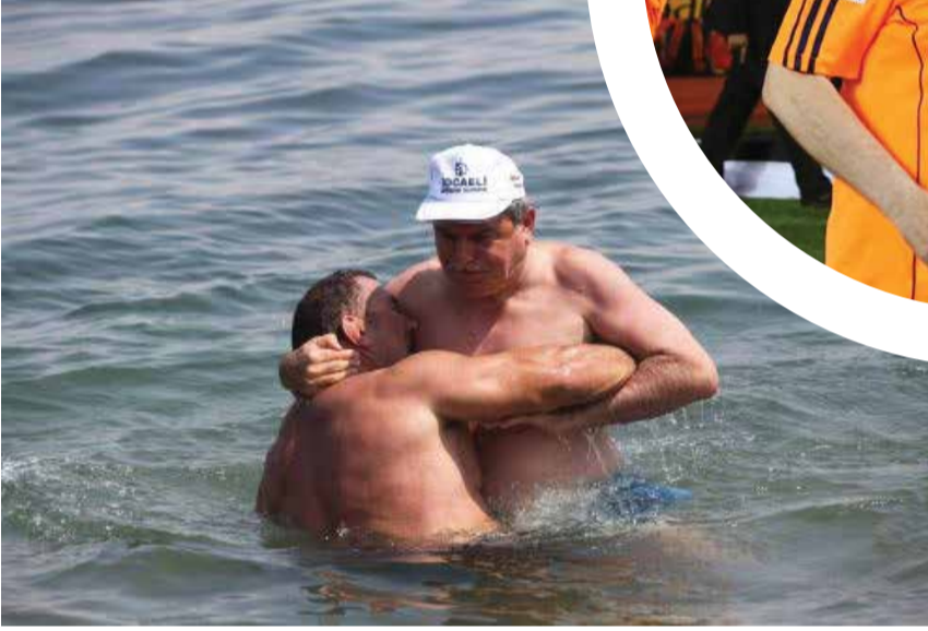
Kocaeli Büyükşehir Belediye Başkanı İbrahim Karaosmanoğlu