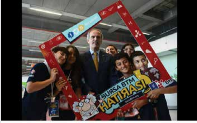
Recep ALTEPE @recep_altepe · 14 Ağu Bilim ve Teknoloji Merkezi'nde aynı zamanda yaz kampı ve bilimsel gözlem faaliyetleri de düzenleniyor pic.twitter.com/bYkFY7nQSh