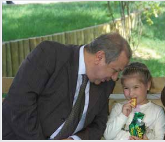
Osman Develioğlu 19 Şubat Beğen · Yorum Yap · Paylaş 10 kişi bunu beğendi. Yorum yaz