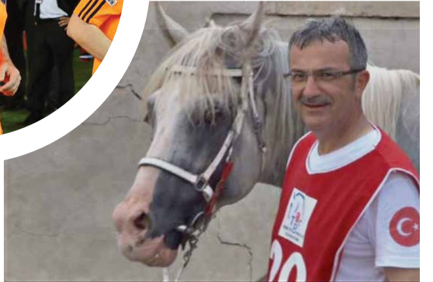
Gebze Belediye Başkanı Adnan Köşker