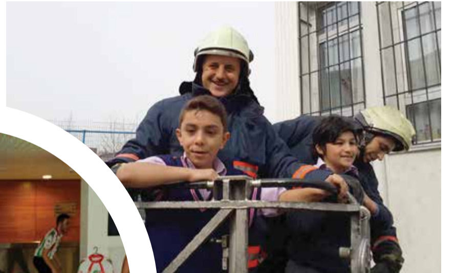
Bağcılar Belediye Başkanı Lokman Çağırıcı