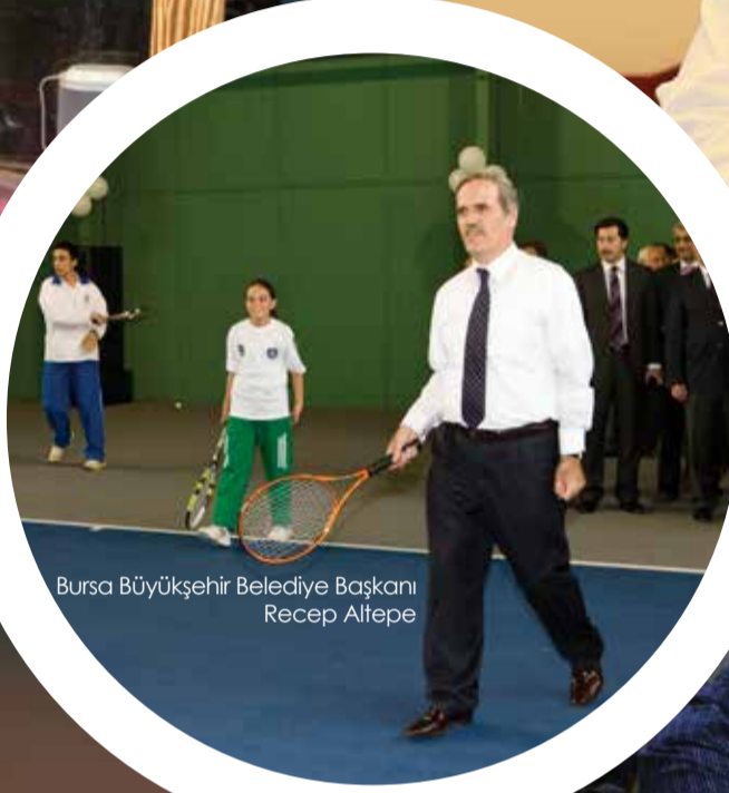
Bursa Büyükşehir Belediye Başkanı Recep Altepe