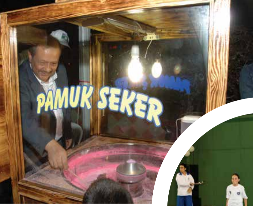
Bahçelievler Belediye Başkanı Osman Develioğlu

Yoğun çalışma tempolarına rağmen halkın içinden çıkmayan ve vatandaşla sıcak iletişim kuran belediye başkanlarımızın hayata dair fotoğraflarını yayınlıyor, devamını belediyelerimizden bekliyoruz.