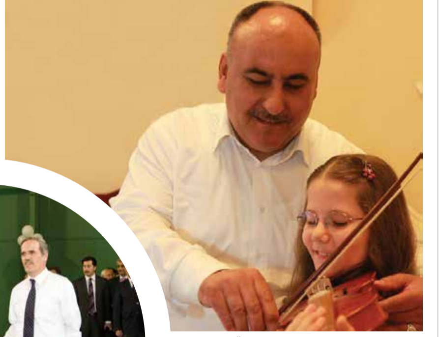
Ümraniye Belediye Başkanı Hasan Can