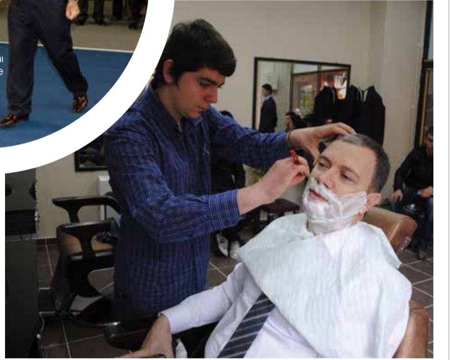
Uzunköprü Belediye Başkanı Av. Enis İşbilen