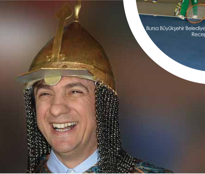
Beyoğlu Belediye Başkanı Ahmet Misbah Demircan