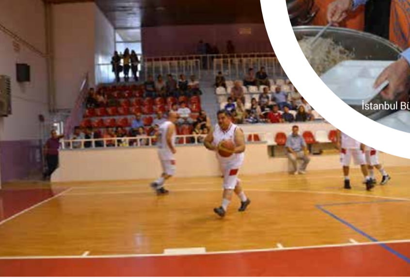
Bilecik Belediye Başkanı Selim Yağcı