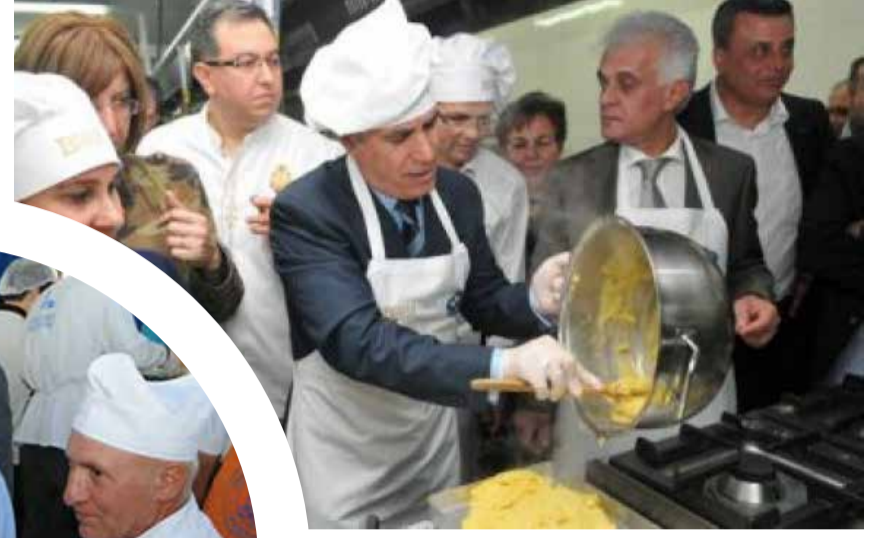
Nilüfer Belediye Başkanı Mustafa Bozbeğ