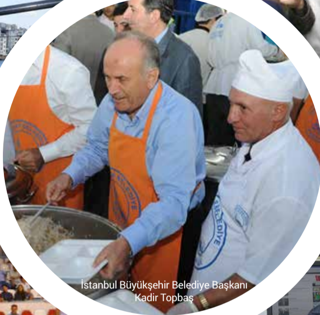
Istanbul Büyükşehir Belediye Başkanı Kadir Topbaş