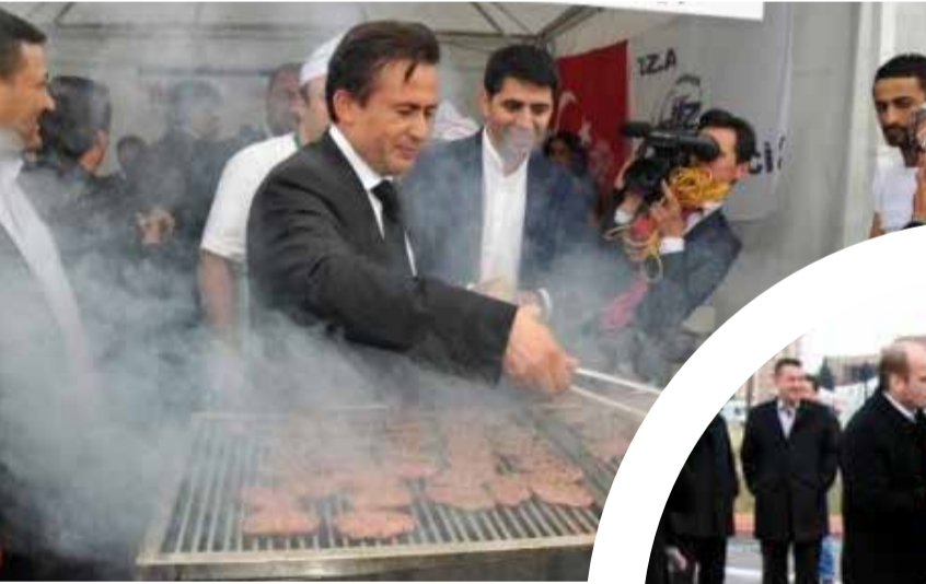
Tuzla Belediye Başkanı Şadi Yazıcı