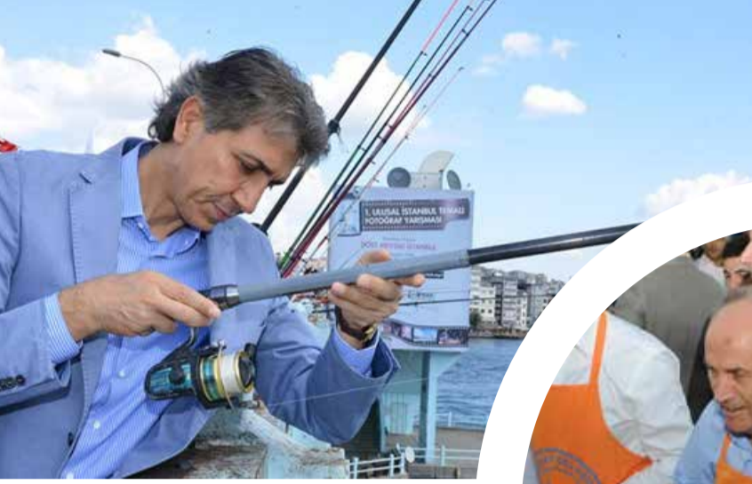
Fatih Belediye Başkanı Mustafa Demir

Yoğun çalışma tempolarına rağmen halkın içinden çıkmayan ve vatandaşla sıcak iletişim kuran Belediye Başkanlarımızın hayata dair fotoğraflarını yayınlıyor, devamını belediye- rimizden bekliyoruz.