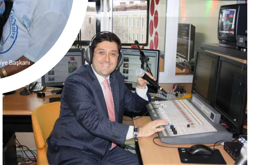
Beşiktaş Belediye Başkanı Murat Hazinedar