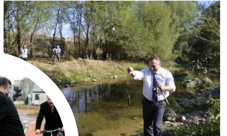
Bolu Belediye Başkanı Alaaddin Yılmaz