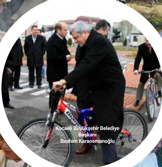
Kocaeli Büyükşehir Belediye Başkanı İbrahim Karaosmanoğlu