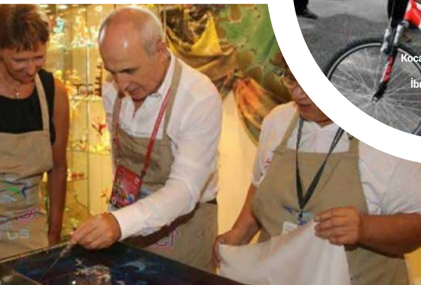
Büyükçekmece Belediye Başkanı Hasan Akgün