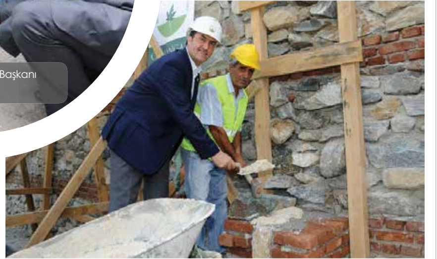
Osmangazi Belediye Başkanı Mustafa Dündar