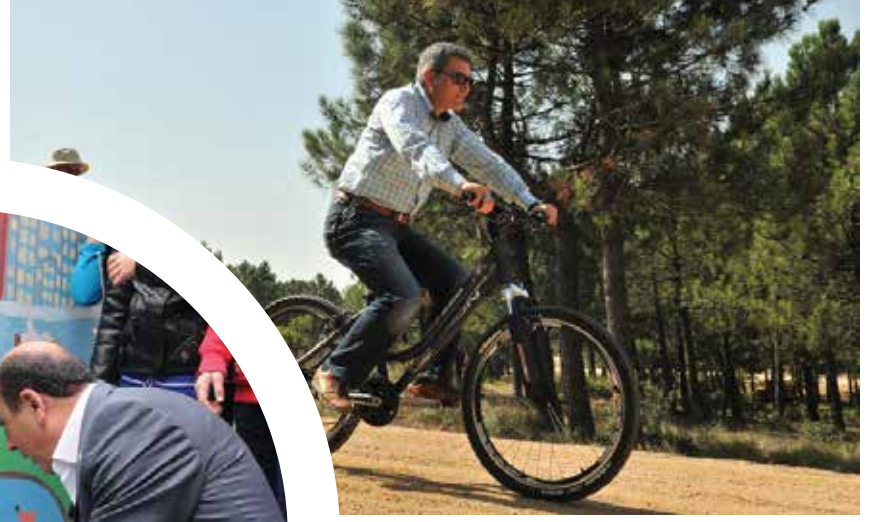
Pendik Belediye Başkanı Kenan Şahin