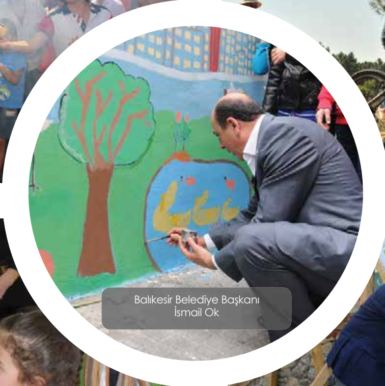
Balıkesir Belediye Başkanı İsmail Ok