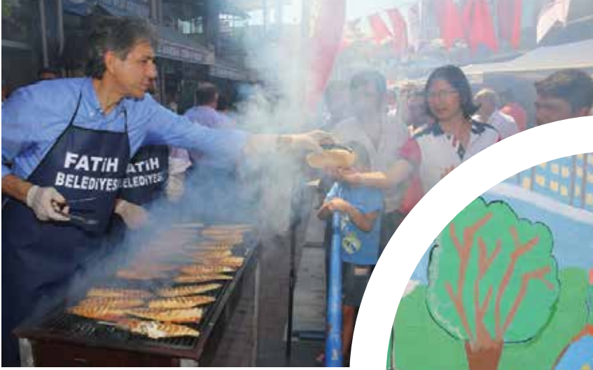
Fatih Belediye Başkanı Mustafa Demir

Yoğun çalışma tempolarına rağmen halkın içinden çıkmayan ve vatandaşla sıcak iletişim kuran belediye başkanlarımızın hayata dair fotoğraflarını yayınlıyor, devamını belediyelerimizden bekliyoruz.