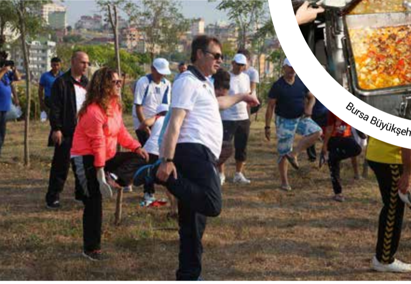
Çayırova Belediye Başkanı Şevki Demirci