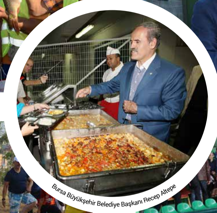
Bursa Büyükşehir Belediye Başkanı Recep Altepe