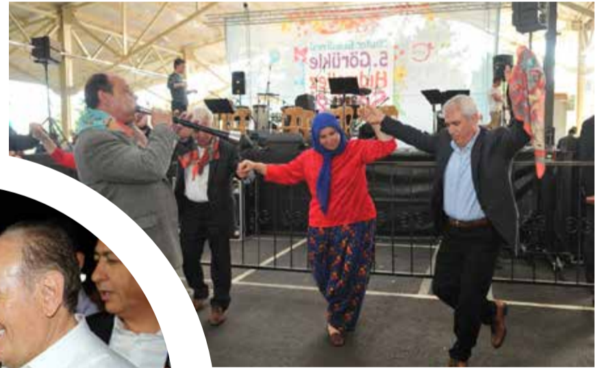
Nilüfer Belediye Başkanı Mustafa Bozbey