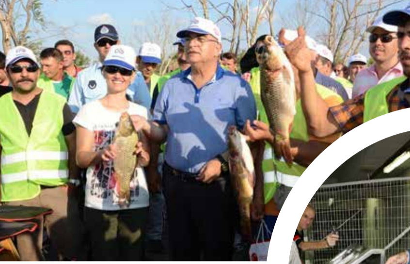
Çorlu Belediye Başkanı Ünal Baysan

Yoğun çalışma tempolarına rağmen halkın içinden çıkmayan ve vatandaşla sıcak iletişim kuran belediye başkanlarının renkli yüzlerini sizlerle paylaşıyoruz.