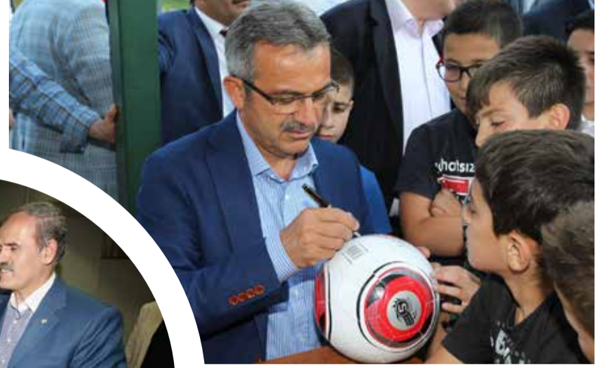
Gebze Belediye Başkanı Adnan Köşker