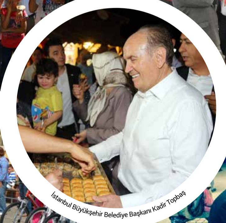
İstanbul Büyükşehir Belediye Başkanı Kadir Topbaş