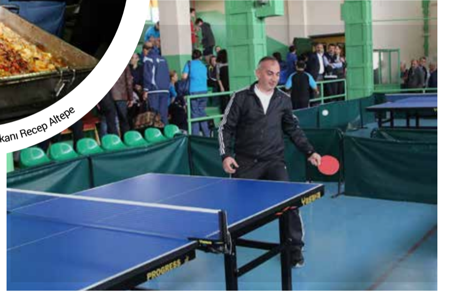
Sapanca Belediye Başkanı Aydın Yılmaz