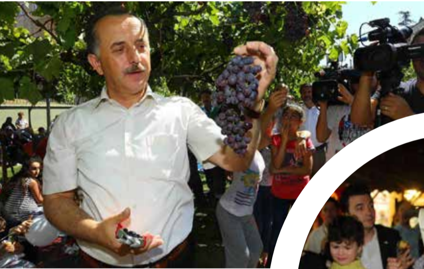
Bağcılar Belediye Başkanı Lokman Çağırıcı