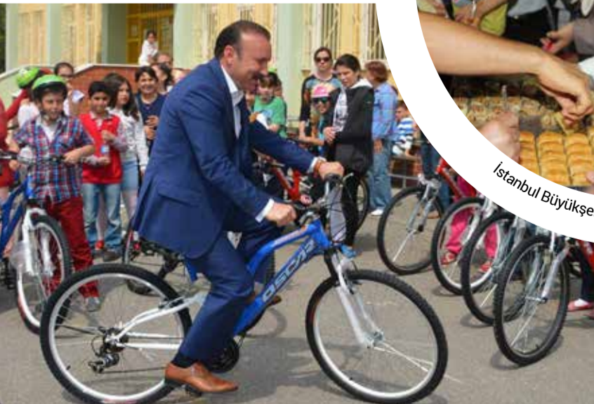
İzmit Belediye Başkanı Nevzat Doğan