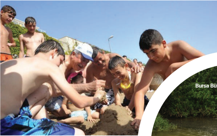
Kocaeli Büyükşehir Belediye Başkanı İbrahim Karaosmanoğlu