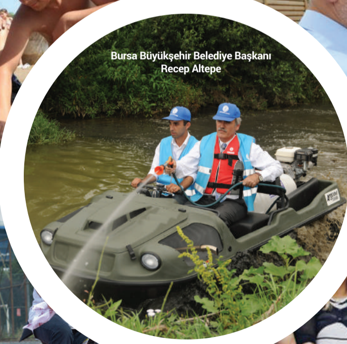
Bursa Büyükşehir Belediye Başkanı Recep Altepe