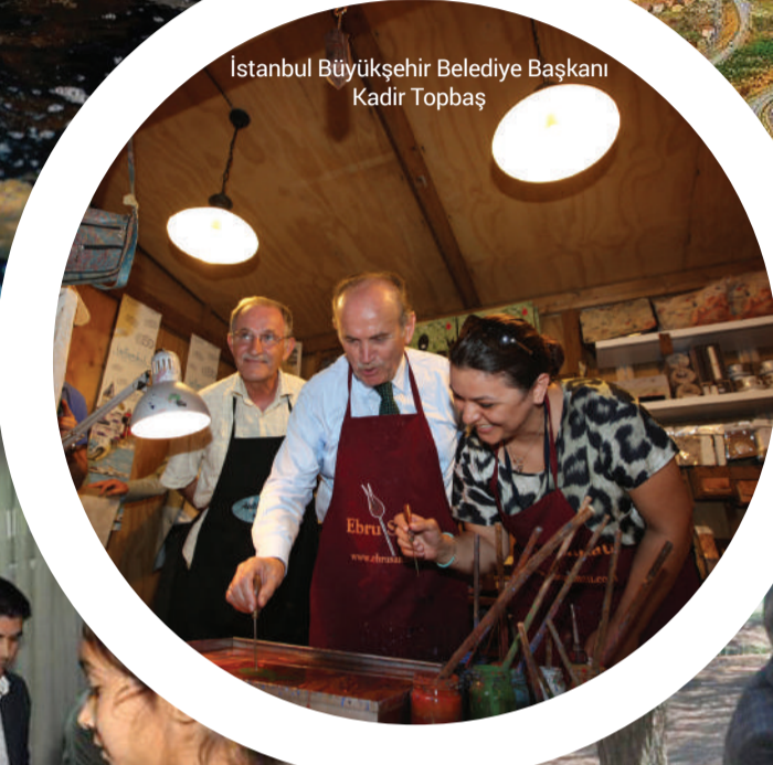
İstanbul Büyükşehir Belediye Başkanı Kadir Topbaş