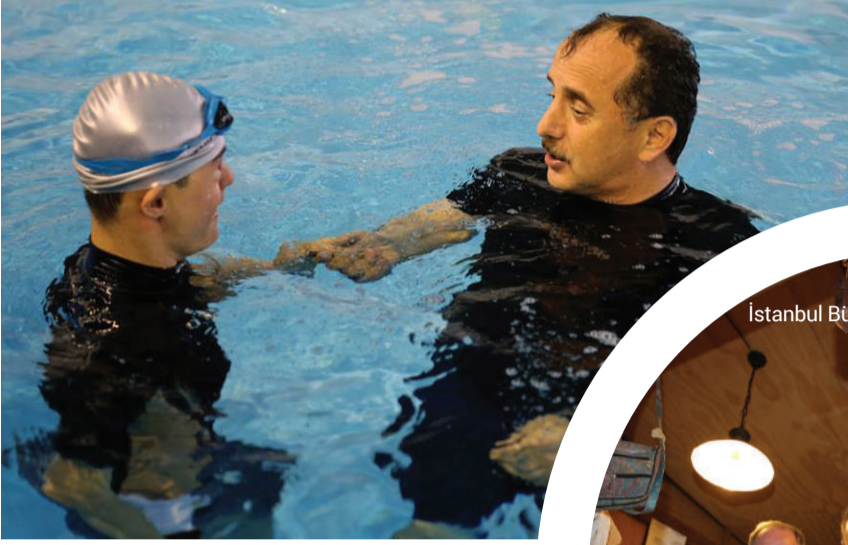
Bağcılar Belediye Başkanı Lokman Çağırıcı

Yoğun çalışma tempolarına rağmen halkın içinden çıkmayan ve vatandaşla sıcak iletişim kuran belediye başkanlarımızın hayata dair fotoğraflarını yayınlıyor, devamını belediyelerimizden bekliyoruz.