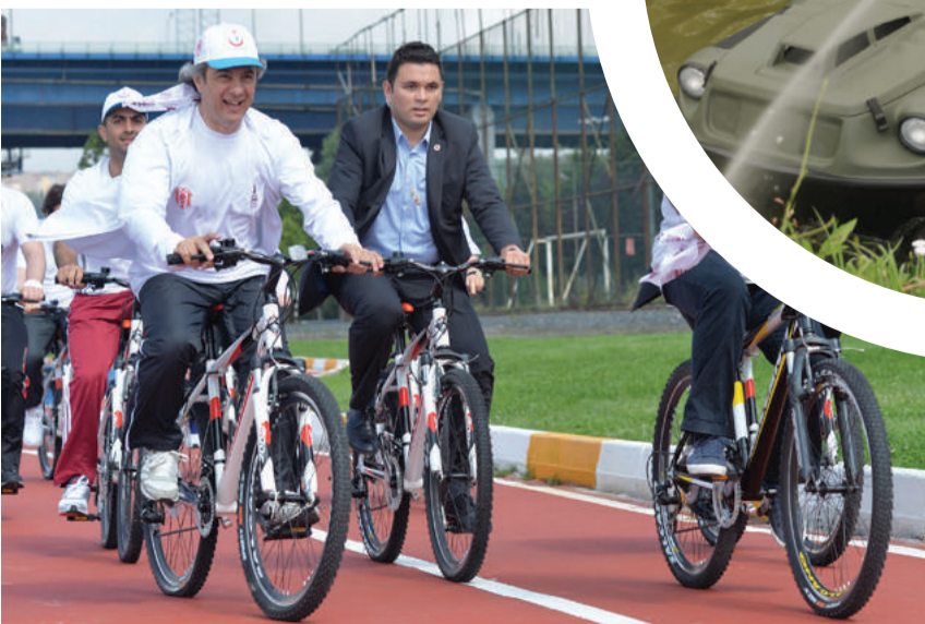
Beyoğlu Belediye Başkanı Ahmet Misbah Demircan