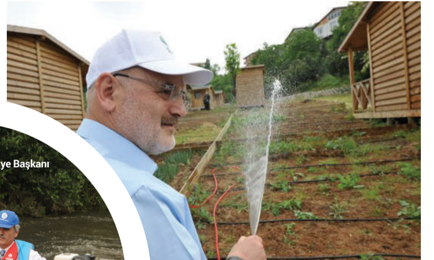
Beykoz Belediye Başkanı Yücel Çelikkbilek