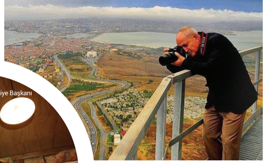
Büyükçekmece Belediye Başkanı Hasan Akgün