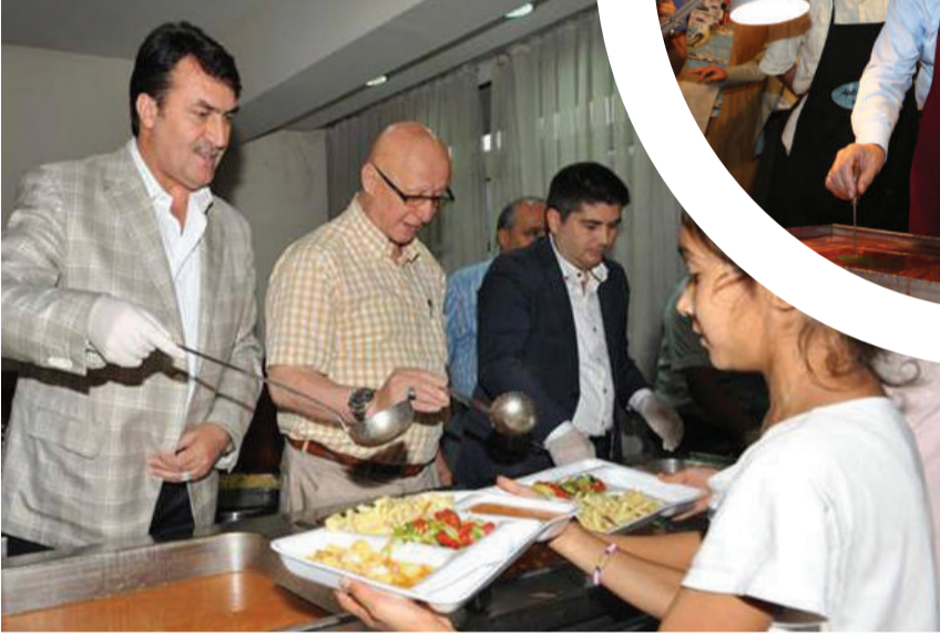
Osmangazi Belediye Başkanı Mustafa Dündar