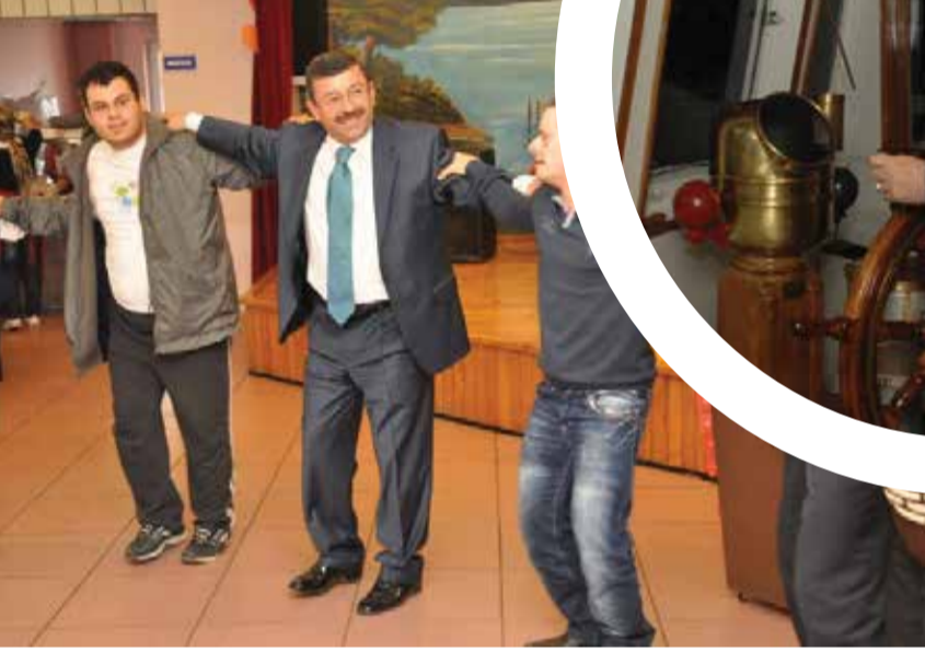
Danca Belediye Başkanı Şükrü Karabacak