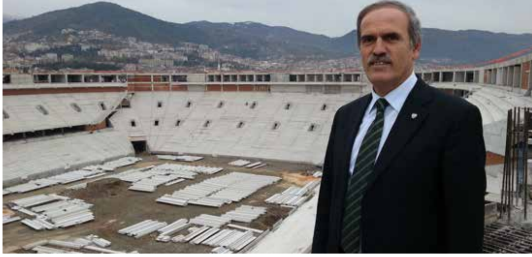
Bursa Büyükşehir Belediye Başkanı Recep Altepe, yapımı devam eden stadyumda incelemelerde bulundu.

Bursa Büyükşehir Belediye Başkanı Recep Altepe, yapımı devam eden stadin tribünlerinde AA muhabirine yaptığı açıklamada, stadin kaba inşaatının yüzde 97 oranında tamamlandığını, yavaş yavaş ince işçilik çalışmalarının başladığını, çatı montajının da başlanması için son hazırlıklara geldiğini söyledi. Stat inşaat alanının 180 bin metrekare olduğunu bildiren Altepe, çelik çatıyı oluşturacak ham maddenin yüzde 20'sinin Türkiye'de üretilen sac ve borulardan üretildiğini, diğer yüzde 80'lik