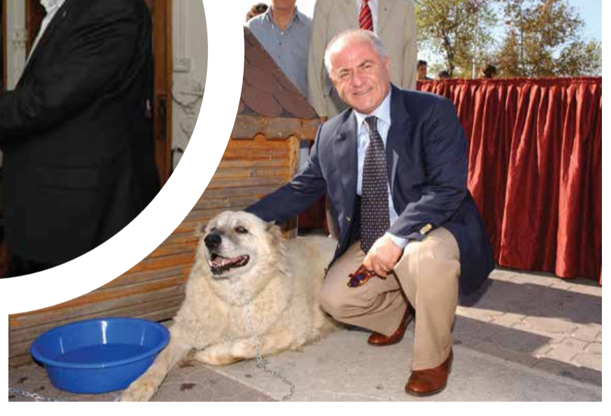
Kadıköy Belediye Başkanı Selami Öztürk