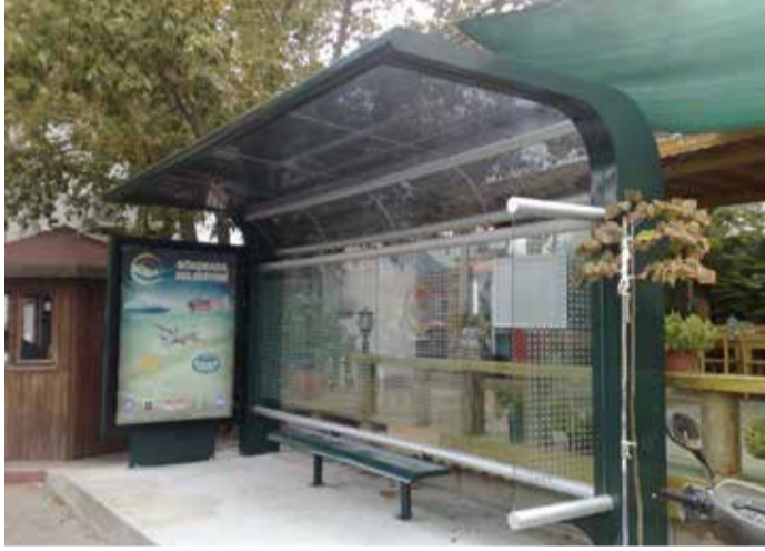
Gökçeada Belediyesi tarafından otobüs durakları yenilendi. Bu duraklar ilçeye ayrı bir güzellik kattı.