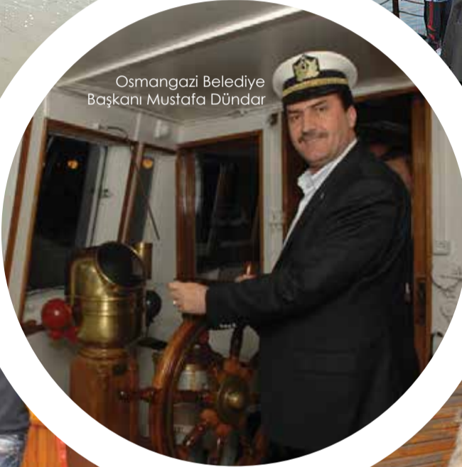
Osmangazi Belediye Başkanı Mustafa Dünder