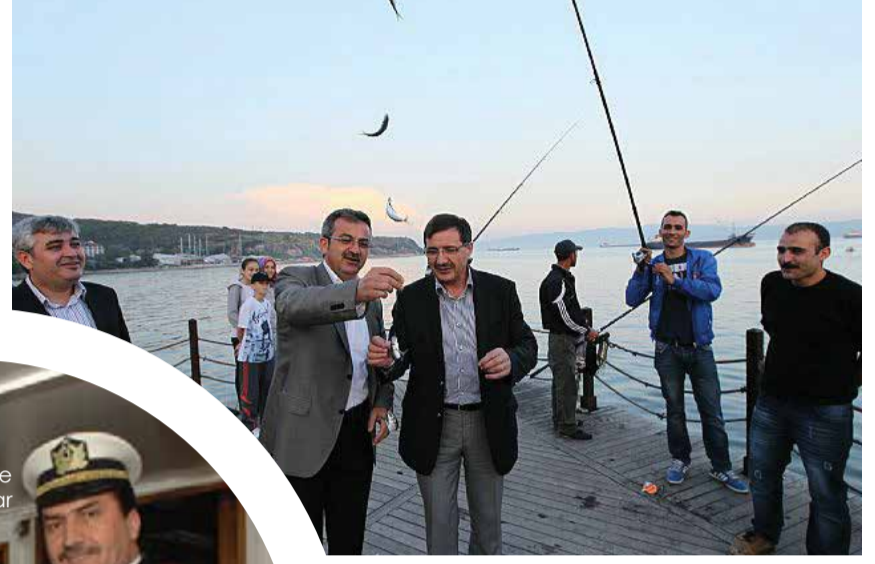
Gebze Belediye Başkanı Adnan Köşker