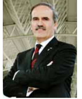
Recep ALTEPE Birlik Başkanı Bursa Büyükşehir Belediye Başkanı

Bu vesile ile ekip arkadaşlarım adına hepinize sağlık, mutluluk ve başarılar dilerim.