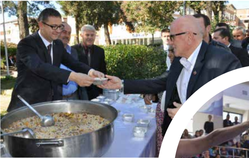
Kandıra Belediye Başkanı Ünal Köken