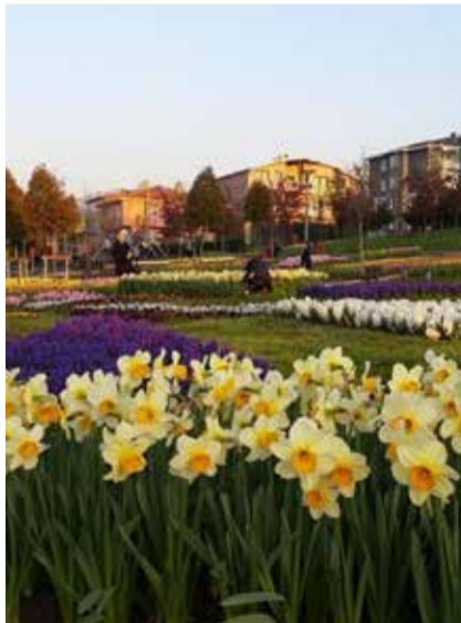
RECEP ALTEPE /recep_altepe

Bursa Büyükşehir Belediye Başkanı Recep Altepe, bu güzel çiçekleri Instagram hesabında paylaştı.