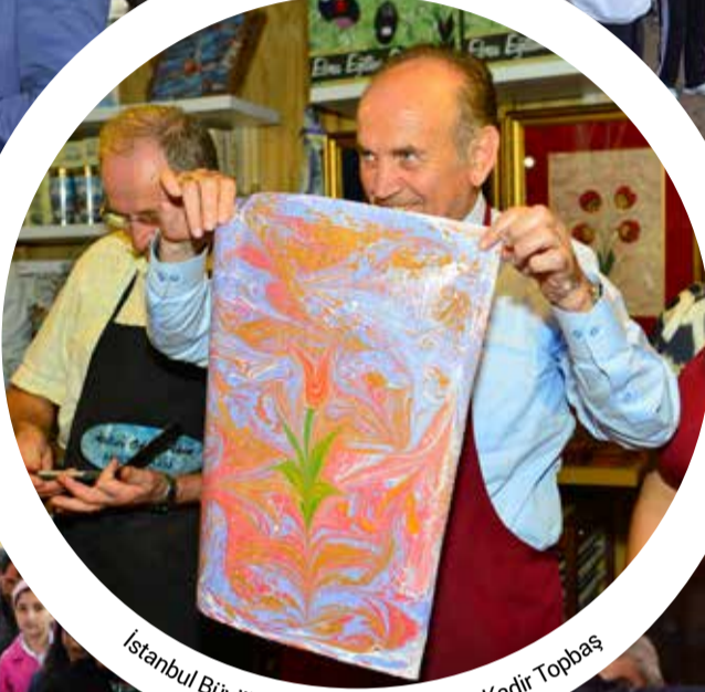
İstanbul Büyükşehir Belediye Başkanı Kadir Topbaş