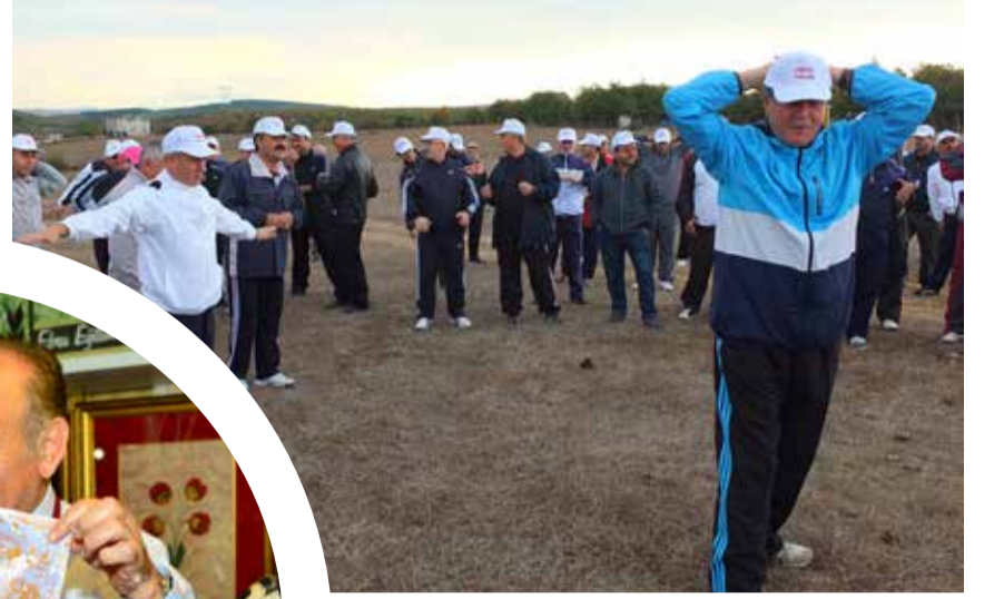
Kocaeli Büyükşehir Belediye Başkanı İbrahim Karasmanoğlu