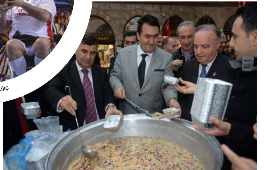
Osmangazi Belediye Başkanı Mustafa DüNDAR