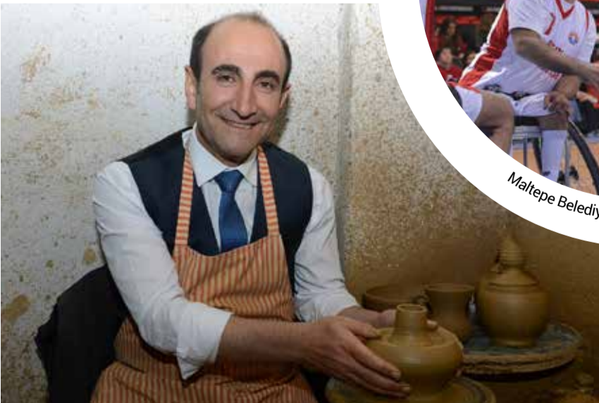
Yıldırım Belediye Başkanı İsmail Hakkı Edebali