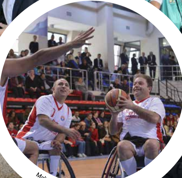
Maltepe Belediye Başkanı Ali Kılıç