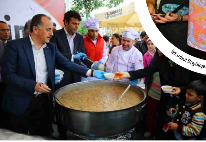
Bağcılar Belediye Başkanı Lokman Çağırıcı