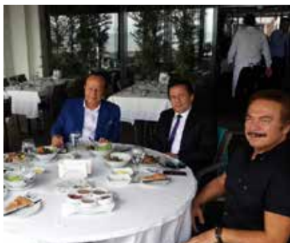
ŞADİ YAZICI /drsadiyazici2

Tuzla Belediye Başkanı Şadi Yazıcı ve Orhan Gencebay bir araya geldiler ve bu fotoğrafı çektiler. Başkan Instagram'ında paylaştı.