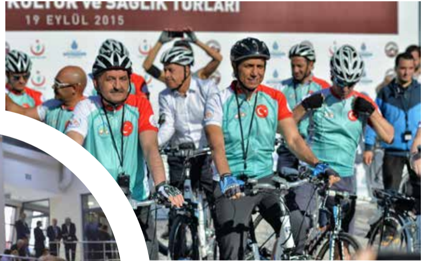
Fatih Belediye Başkanı Mustafa Demir