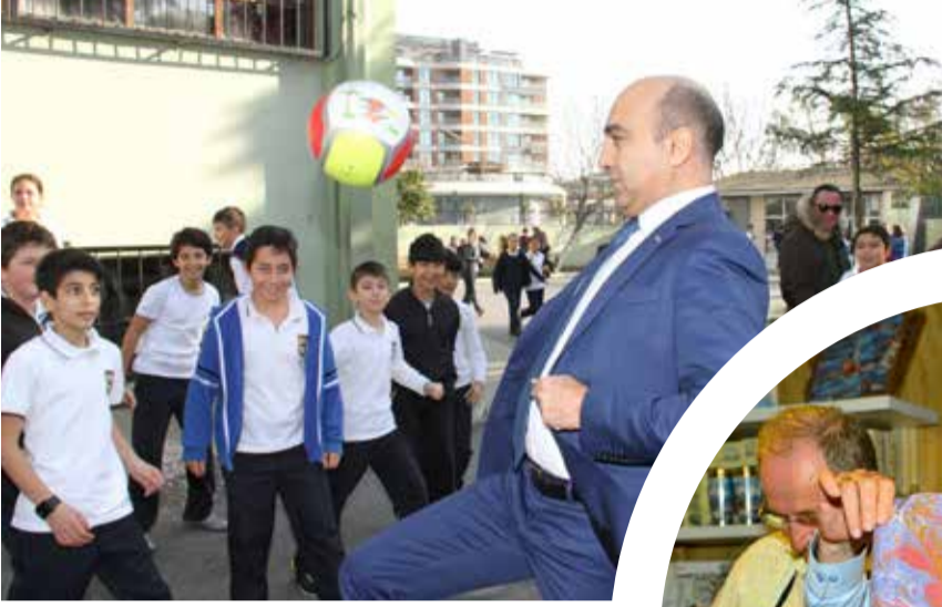
Bakırköy Belediye Başkanı Bülent Kerimoğlu

Yoğun çalışma tempolarına rağmen halkın içinden çıkmayan ve vatandaşla sıcak iletişim kuran belediye başkanlarının renkli yüzlerini sizlerle paylaşıyoruz.