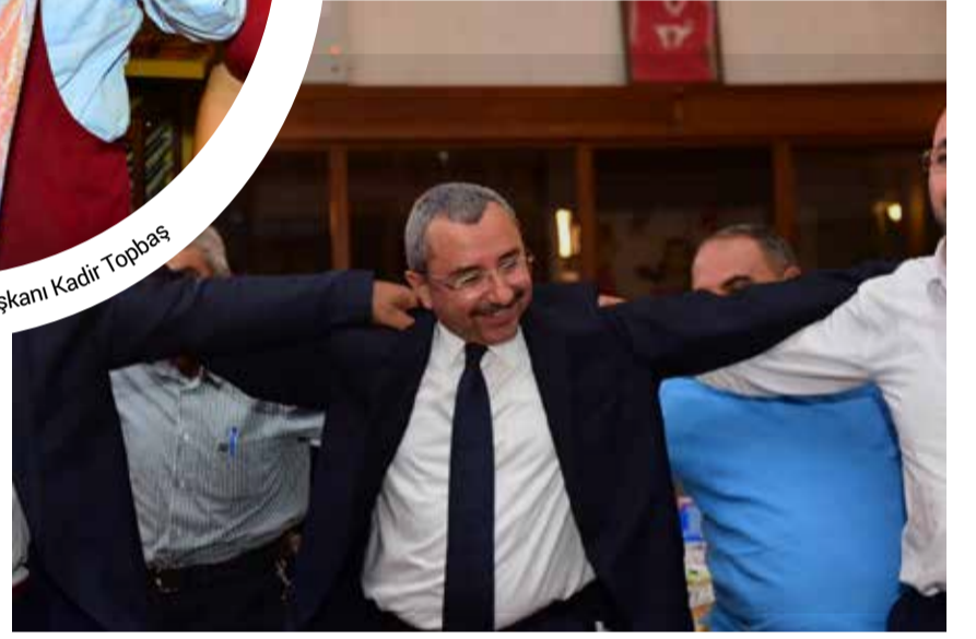
Sancaktepe Belediye Başkanı İsmail Erdem