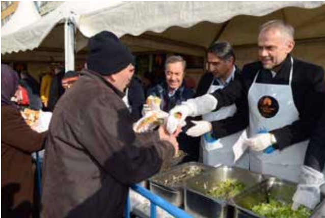
Ahmet Poyraz Çekmeköy Belediye Başkanı