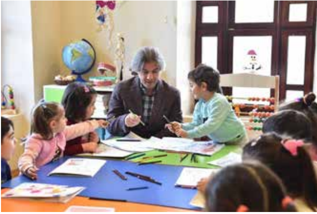
Ahmet Misbah Demircan Beyoğlu Belediye Başkanı

www.marmara.gov.tr www.marmarahaber.gov.tr