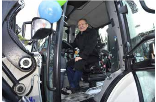
Ahmet Edip Uğur Balıkesir Büyükşehir Belediye Başkanı