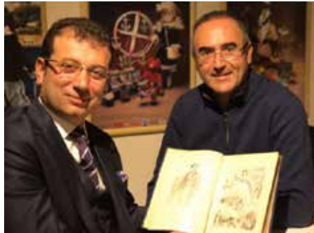
Ekrem İmamoğlu @ekrem_imamoglu

Beylikdüzü Belediye Başkanı Ekrem İmamoğ- lu, Sunay Akın ile buluşmasındaki sürprizi takipçileriyle paylaştı.