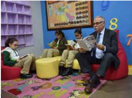
Ülgür Gökhan @BSKulgurgokhan