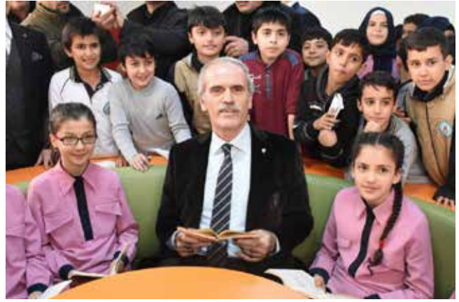
Recep Altepe Bursa Büyükşehir Belediye Başkanı