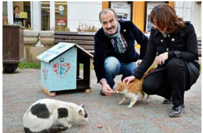
Hayri Türkyılmaz Mudanya Belediye Başkanı