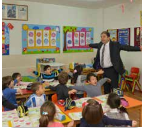
Ali Kılıç @BskAliKilic

Maltepe Belediye Başkanı Ali Kılıç, çocuklara olan sevgisini attığı bu fotoğrafla bir kez daha içtenlikle gösteriyor.