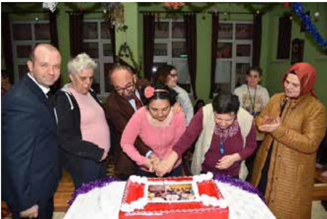
Hüseyin Üzülmöz Kartepe Belediye Başkanı